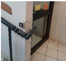
Rez-de-chaussée avec bouton d'appel (aide)

Ascenseur sur l'ensemble des sites , où les formations sont dispensées à l'étage ou sites disposant de marches pour accéder aux salles (Cholet, Challans, La Rochelle, La Roche-sur-Yon). (Exemple Cholet ci-dessous)