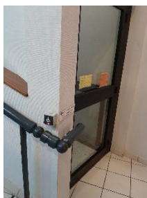
Bouton d'appel (aide)